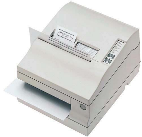
TM-U950 mit Bon- und Belegdruck, Journalfunktion und Papierschneider

EPSON stellt für die Programmentwicklung OPOS-Treiber zur Verfügung und bietet dadurch eine höhere Flexibilität und Leistungsfähigkeit bei der Softwareentwicklung.